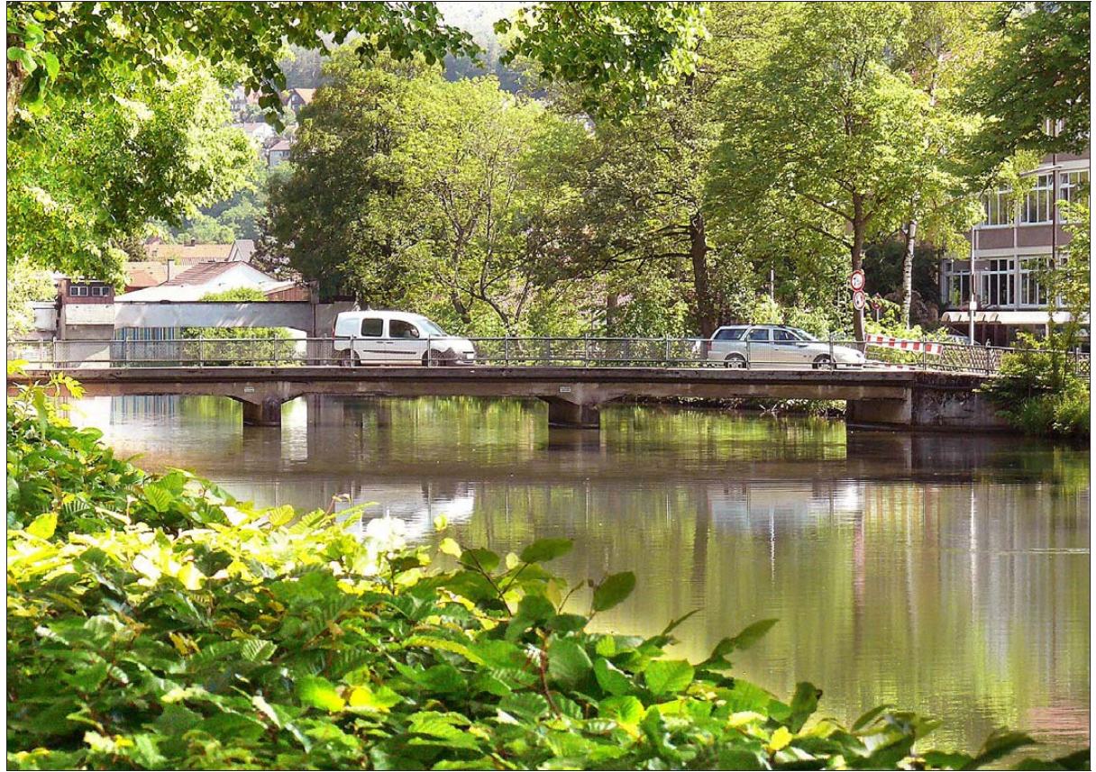
Der Sanierungsbedarf an Nagolds Schiffsbrücke ist dringend. Statt zu renovieren, soll nun neu gebaut werden.

Doch Veränderungen gibt es in der Umgebung noch genug. Schließlich umfassen die ersten Bauphase die Gebiete rund um die Zellerschule und das OHG. Unter anderem soll die Verknüpfung zwischen der Marktstraße und dem Gartenschauengelände Kleb herausgearbeitet werden - mit einer