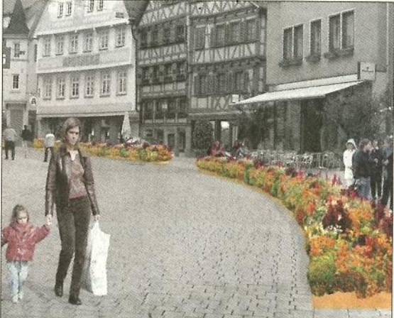
Die geplanten roten Teppiche können auch gelb sein (großes Bild). Weitere Vorschläge sind die »Grüne Lounges« (oben) und der »Swing«.