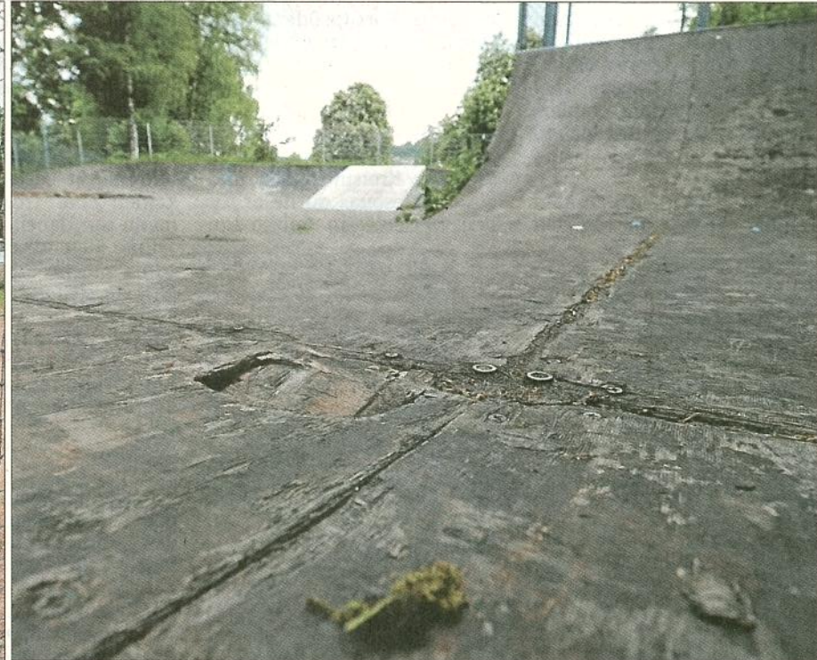
Auf dem ehemaligen ABG-Gelände wäre noch Platz für ein Beach-Volleyballfeld. Auch die Skateranlage am Badepark gehört eigentlich erneuert. Doch für beides ist die Finanzierung noch ungewiss.

arbeit auszuloten. Zudem prüft die Stadt derzeit, ob auf dem Gelände des ehemaligen Aufbaugymnasiums, das dem Land gehört, ein Volleyballfeld errichtet werden könnte. Diese Maßnahme und der Bau eines zweiten Volleyball-